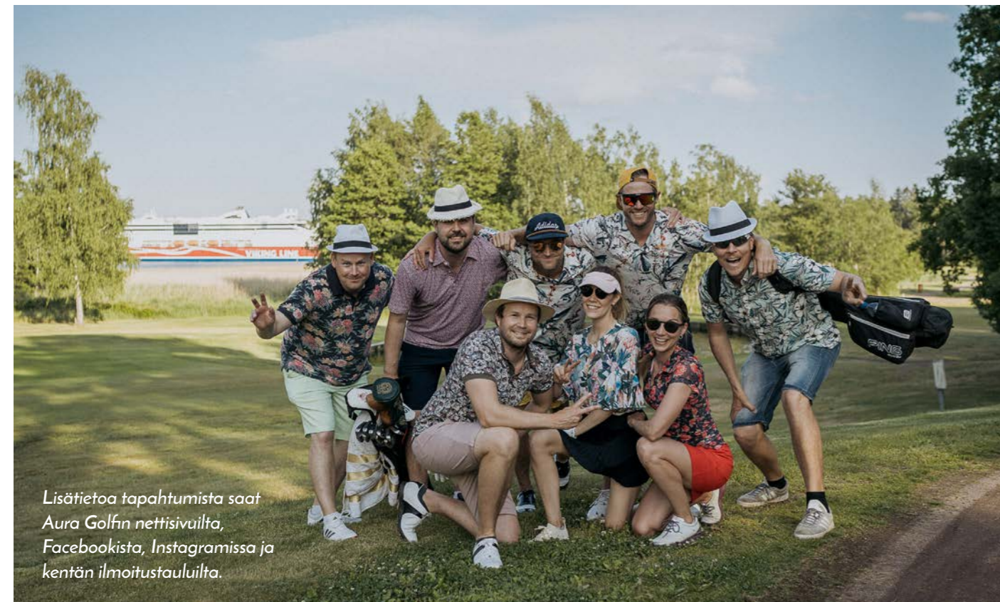
Lisätietoa tapahtumista saat Aura Golfin nettisivuilta, Facebookista, Instagramissa ja kentän ilmoitustauluilta.

Pro Shopin toimintaa jatkaa Golfpuoti Oy ja golfravintolan yrittäjänä jatkaa Keilapojat Oy. Aura Golfilla on tavoitteena yhdessä golfravintolan yrittäjien kanssa kehittää ravintolan toimintaa ja pyrkiä aikaisempaa korkeampaan asiakastyty-väisyyteen.